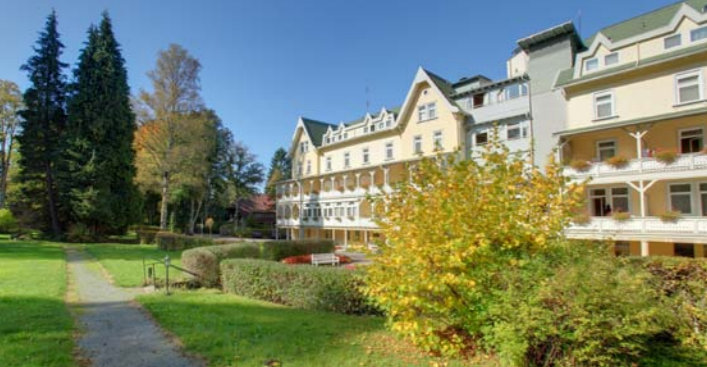
Die Celenus Klinik Schömberg