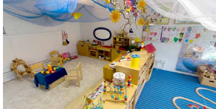
Spielzimmer mit Puppen- und Bauecke