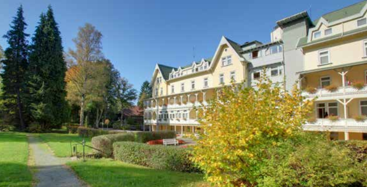
Die Celenus Klinik Schömberg