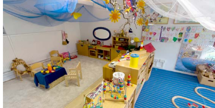
Spielzimmer mit Puppen- und Bauecke