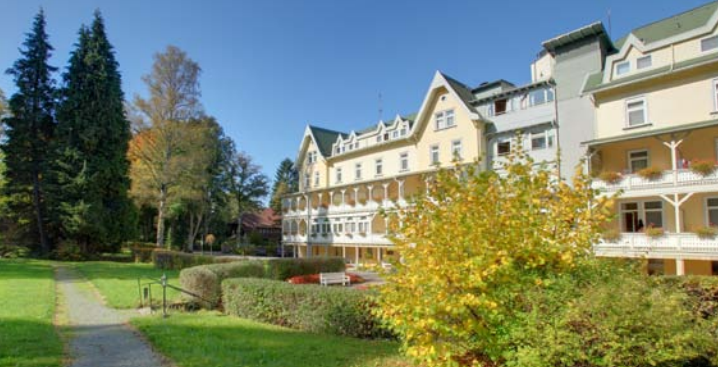
Die Celenus Klinik Schömberg